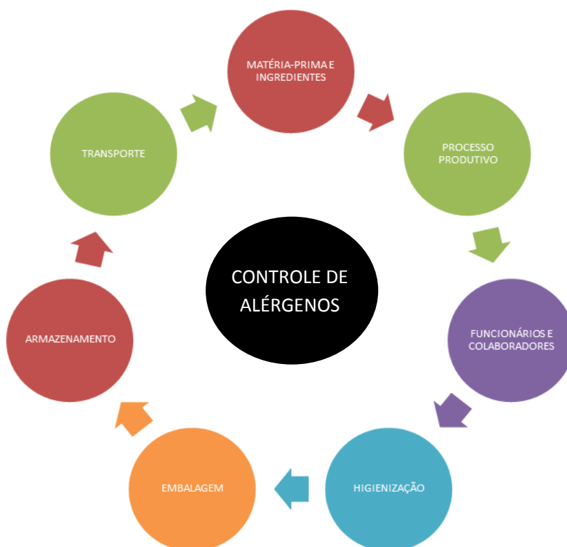
FIGURA 2. Aspectos relevantes para o controle de alérgenos.

Eventualmente, medidas suplementares deverão ser implementadas com o enfoque específico de evitar que os alimentos produzidos apresentem substâncias alergênicas advindas de contaminação cruzada. No intuito de apoiar o processo de identificação das etapas críticas e medidas de controle que devem ser implementadas pela empresa, estão apresentados a seguir aspectos relevantes que devem ser abordados no controle de alérgenos.